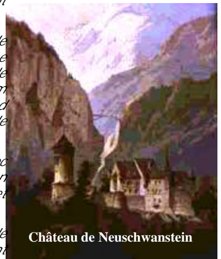
Château de Neuschwanstein

Le film serait projeté dans sa version intégrale, en allemand avec sous-titres en français, et non dans sa version doublée en français, version fortement amputée, ce qui altère, bien évidemment la cohésion du récit et prive le film de scènes indispensables pour restituer le climat d'authenticité.