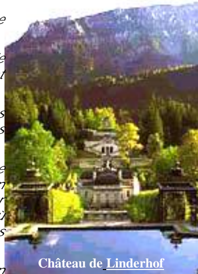
Château de Linderhof

Reprise de la projection à 16 h 30 et fin à 18 h 30 .