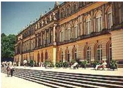
Château de Herrenchiemsee

Ici, tout est vrai : les « châteaux de rêve » où d'innombrables visiteurs viennent aujourd'hui revivre l'exaltation romantique des anciennes légendes, vous les découvrirez habités par les personnages qui les ont autrefois marqués de leur empreinte.