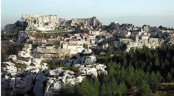
Baux de Provence

Retour par MAUSSANNE LES ALPILLES en passant par la chaîne des Alpilles. Dîner et logement à l'hôtel. Animation en soirée.