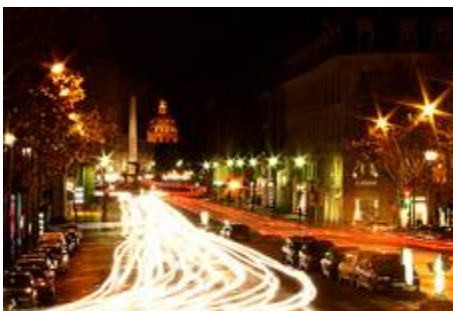
Percée en 1757, la Rue Royale attenante à la Place Louis XV – actuelle Place de la Concorde – continuait la perspective tracée par le nouveau pont lancé sur la Seine.