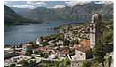
Baie de Kotor