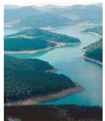
Rivière de Tara