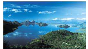
Lac de Skadar