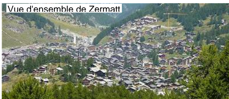
Vue d'ensemble de Zermatt