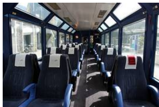
Le Golden Pass Panoramic