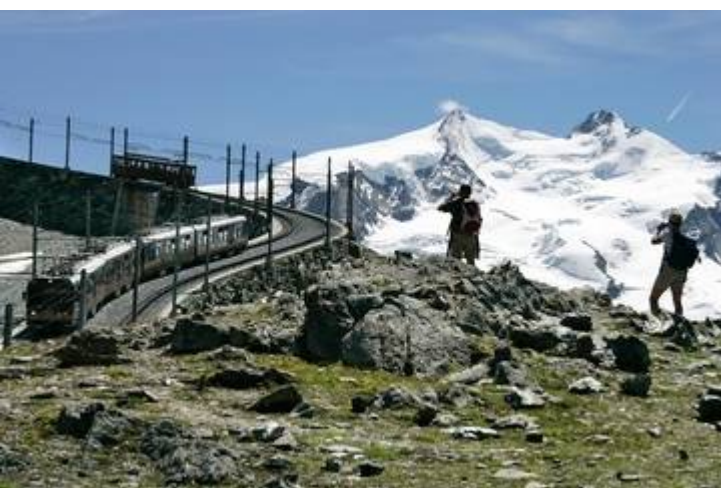
Chemin de fer du Gornergrat devant le massif du Mont Rose