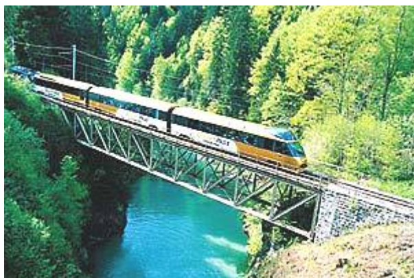
Le Golden Pass Panoramic